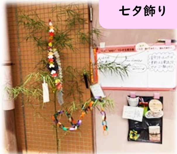
掲示板横の 七夕飾り