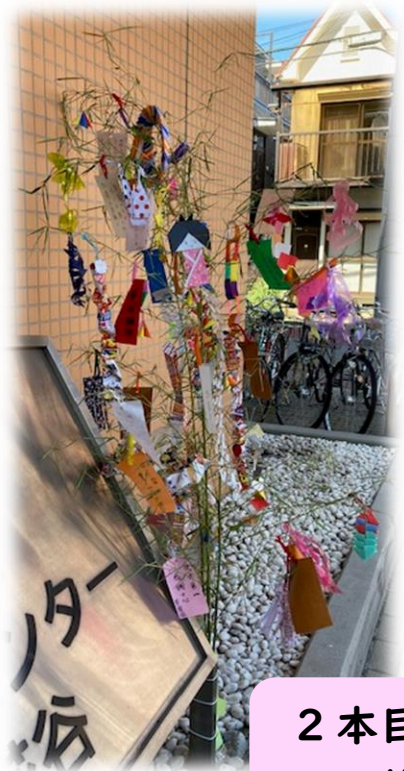
2 本目の 七夕飾り