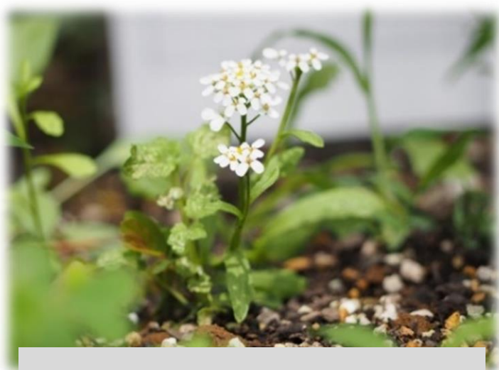
小さいお花畑ではやっと白い花が可憐に