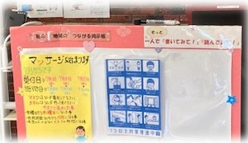
東糀谷いこいの家

ぜひ皆さま、見に来てちょっと書き込んでください!! 近々バージョンアップする予定です。お楽しみに♪