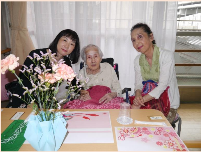
9月16日(日) 祝 特別養護老人ホーム敬老祝賀会