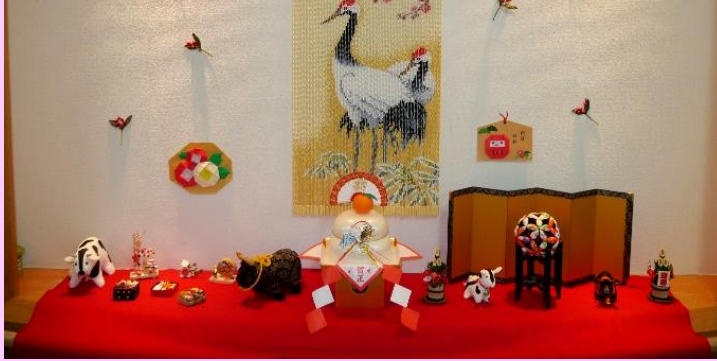
1月1日 特別養護老人ホーム 初詣とお祝い膳