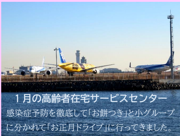
1月の高齢者在宅サービスセンター 感染症予防を徹底して「お餅つき」と小グループ に分かれて「お正月ドライブ」に行ってきました。