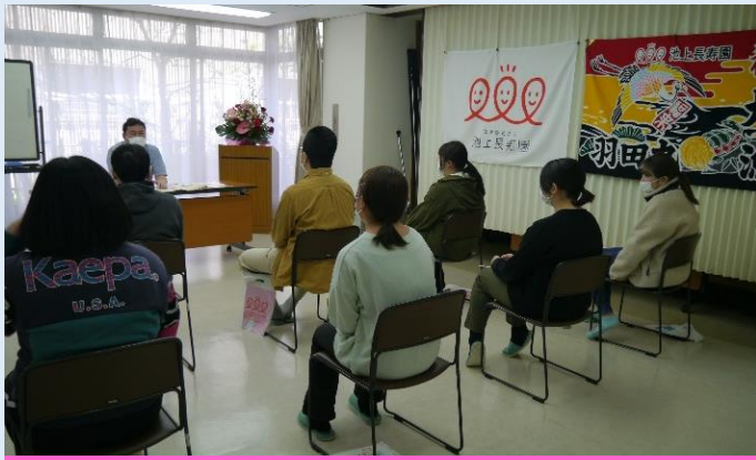
2日 大森事業部門新人職員研修