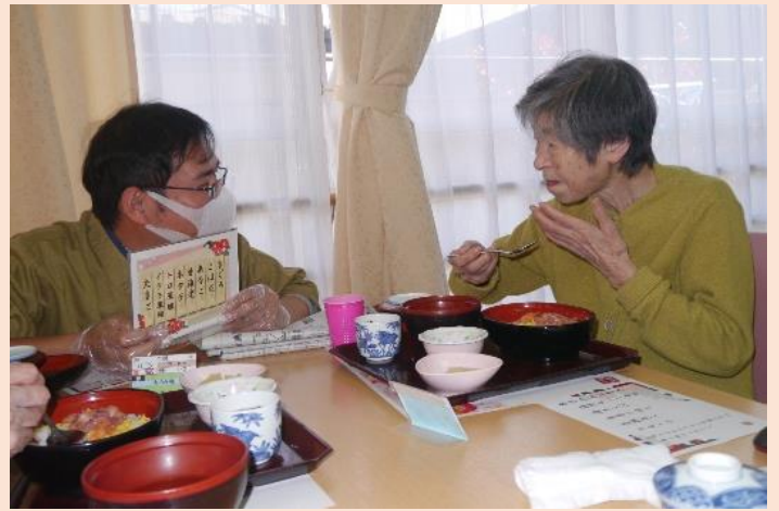
11日 特別養護老人ホーム大森「寿司ランチ」