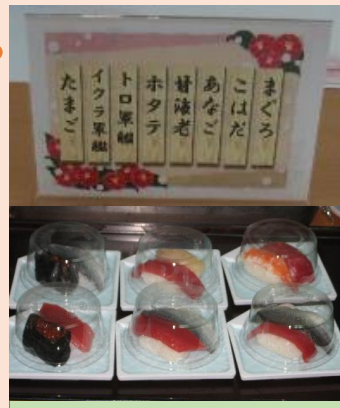
寿司カバーで感染予防!

今年も楽しみなひとときが訪れました。「お決まり」や「お好み」、「海鮮どんぶり」をご用意、一番人気は江戸前の「こはだ」でした。