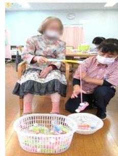
★ペットボトル釣り★