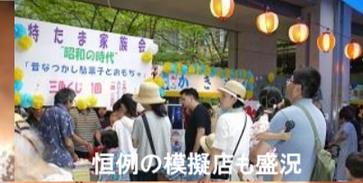
恒例の模擬店も盛況