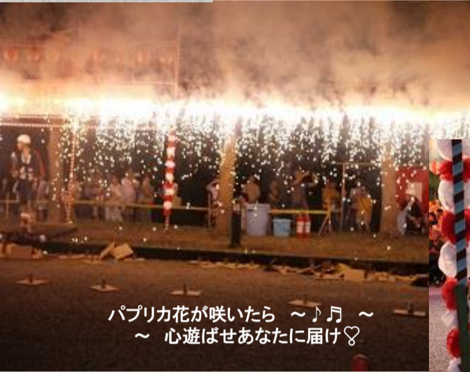
パプリカ花が咲いたら ~♪月~ 心遊ばせあなたに届け♡