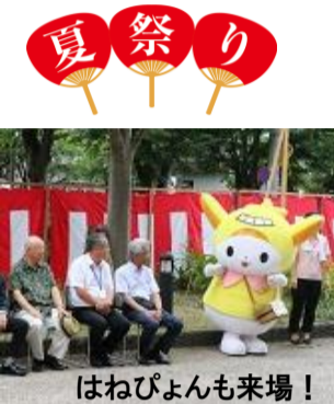
はねびよんも来場!

8/18 (日) この夏、施設最大のイベント「サマーフェスタ」が開催されました。今年もたくさんの方の協力ののもと、皆様のご協力のもと、たくさんの方々と地域の方を迎え利用者の方やその家族も交え盛大に行われました。サマーフェスタの最後を飾る花火では、名物ナイアガラ花火と共に来場の子供たちから「パプリカ」の大合唱! 利用者の方のみならず多くの感動がありました。