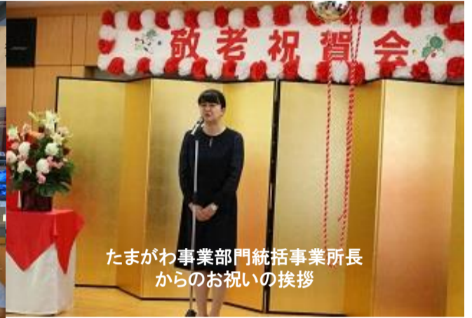
たまがわ事業部門統括事業所長からのお祝いの挨拶