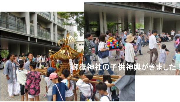
御嶽神社の子供神輿がきました!

9/21 (土) 御嶽神社の子供神輿がきました。子供たちの元気な掛け声が近づく利用者の方は大喜び! お神輿と山車の休憩所として特養たまがわにお寄りいただきました。当日は、利用者の方々は活躍する子ともや親御さんからたくさん声をかけていただき、間近でお神輿にふれることができました。お祭りって楽しいですね!