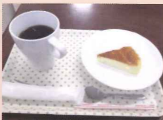
スタッフ自家製のケーキセット 400円

Mail: cafe.lilac118@gmail.com HP: http://cafelilac.webcrow.jp