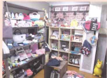
ハンドメイドの雑貨でいっぱいのレンタルBOX

奥はカフェコーナーになっており、軽食や手作りのケーキなどをいただけます。キッズスペースもあるので、ママもお子様を遊ばせながらゆつくりお茶を楽しんだり、お買い物を楽しめます。