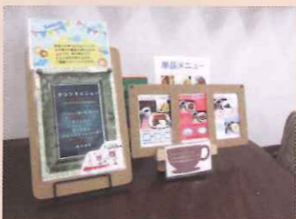
ドリンク 350円 お子様用ドリンク 100円 ランチ 各500円

子育て中のスタッフがアイデアを出し合っ、カフェの運営に携わっています。定期的にベビーマッサージやワークショップなども開かれています。12月11日の受注会を皮切りに「こどもが喜ぶ通園&通学オーダーカタログ」も始まりました。また、カフェルームのレンタルもあります。ワークショップやセミナー、貸切りのプライベートな時間を楽しむなど、いろいろなアイデアでご活用いただけます。詳しくは、こちらへ↑