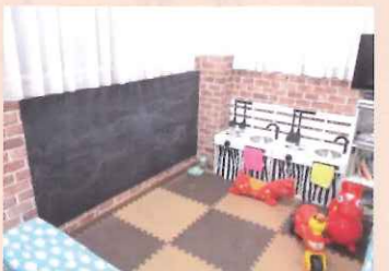
壁いっぱいの黒板にお絵かきしたり、スタッフ手作りのキッチンで遊べます♪

Mail: cafe.lilac118@gmail.com HP: http://cafelilac.webcrow.jp